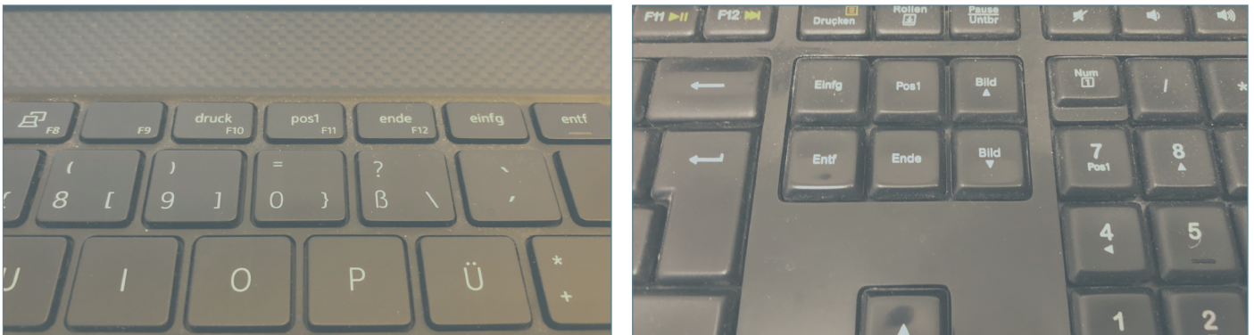
Abb. 3 Home (Pos1) Button auf einer Laptop Tastatur (links) und einer PC-Tastatur (rechts)

Durch Drücken der Home Taste (oder auch Pos1 Taste) springt Chromeleon™ im Chromatogramm auf den ersten Datenpunkt, im 3D-Plot würde Chromeleon™ auf die zuletzt gespeicherte Zoom-Einstellung zurückwechseln. Diese Taste ist gängigerweise auf Laptop- oder PC-Tastaturen zu finden, jedoch nicht auf allen Modellen (Abbildung 3).